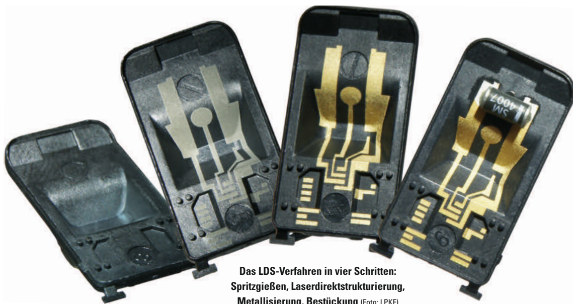
Das LDS-Verfahren in vier Schritten: Spritzgießen, Laserdirektstrukturierung, Metallisierung, Bestückung

Laser-Direct-Structuring-Verfahren bieten bekanntermaßen Designfreiheit, Miniaturisierung und Präzision bei der Herstellung von elektronischen Bauteilen. Doch über die Anwendungsmöglichkeiten der Bauteile entscheidet vor allem das verwendete Polymer. Zur Auswahl stehen verschiedene Kunststoffe.